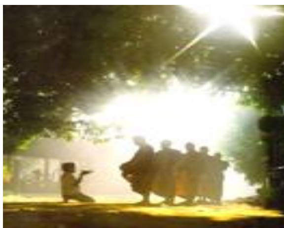
ภาพที่ 2 ภาพแสดงวิถีชีวิตชาวพุทธไทย

จากหลักฐานดังกล่าวสะท้อนให้เห็นว่าพระพุทธศาสนาทั้งฝ่ายเถรวาทและฝ่ายมหายานที่แผ่ขยายไปในทวีปยุโรปมีพัฒนาการและได้รับการตอบรับที่ดีชาวยุโรปให้ความสนใจพระพุทธศาสนาในด้านเนื้อหาเพื่อนำมาใช้ในการดำเนินชีวิต ประยุกต์ใช้ในด้านฝึกปฏิบัติอบรม พัฒนาจิตปัญญา และหลักการทางพุทธศาสนาก็เข้าได้ดีกับวัฒนธรรมแสงปัญญาของชาวยุโรป เพราะหลักการพุทธเน้นการใช้เหตุผล ให้อิสระทางความคิด ไม่ผูกขาดทางความคิด ดังนั้นแม้ศาสนาพุทธจะเป็นสิ่งใหม่สำหรับชาวยุโรป ยังไม่เป็นที่แพร่หลาย ขยายวงกว้างทางสังคม แต่ก็ค่อนข้างเข้ากันได้กับภูมิปัญญาแบบฝรั่ง มีคุณค่าต่อชีวิตปัจเจกบุคคลและสิ่งแวดล้อม จึงอาจกล่าวได้ว่าสภาพการณ์ปัจจุบันของศาสนาพุทธในยุโรปเป็นช่วงของการเริ่มต้นที่ได้รับการยอมรับและมั่นคง การไม่ได้รับปฏิบัติและต่อต้านนับเป็นโอกาสที่ดีของพระพุทธศาสนา ที่จะเติบโตในแผ่นดินยุโรปต่อไป